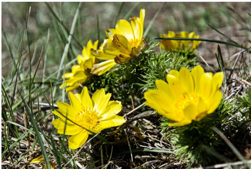
(Adonisröschen_Hammaphotos by Christian Schelauske)

Hinweis: Wir weisen Sie darauf hin, dass Spaziergänge und Wanderungen derzeit ausschließlich gemäß den Vorgaben einzeln, mit einer weiteren nicht im Haushalt lebenden Person oder nur mit der eigenen Familie gemacht werden dürfen.